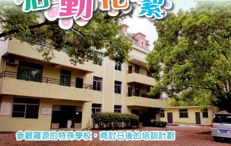
參觀羅源的特殊學校，商討日後的培訓計劃