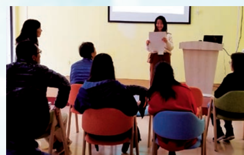
DISC性格及分析與團隊合作培訓

最後亦團結不同界別的義工們，將新點子及經驗帶進國內社會服務的事工。除了有助激發新思維，推動服務發展，長遠來說更可為事工帶來正面影響。