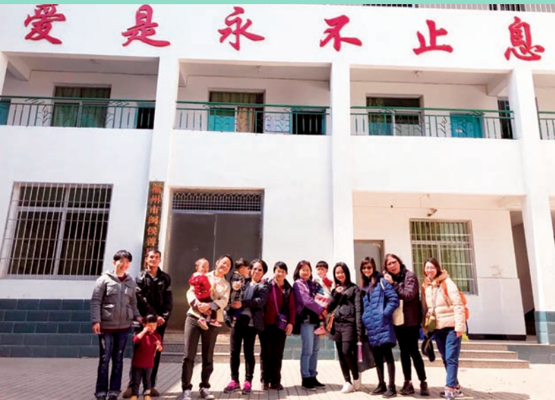
在善恩園與孩子留影