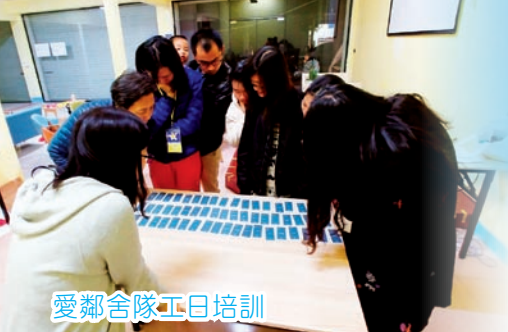
愛鄰舍隊工日培訓

入職不久已深深體會到國內同工服侍的困難和身心乏力，他們常會因為專業知識不足、工資微薄、人手短缺等問題，面對很多掙扎及挑戰，若要使國內機構同工走得更遠，培訓事工是成為他們