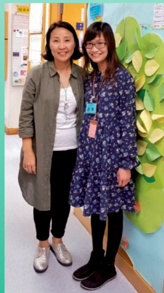
到播道會兒童之家參觀及交流