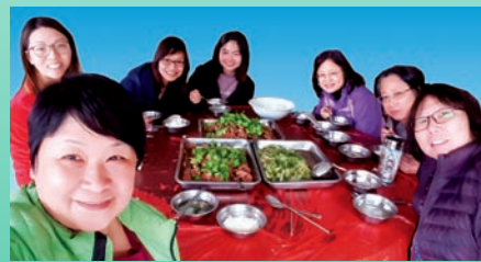
善恩園探訪之行，落實開展新合作，慶祝一番