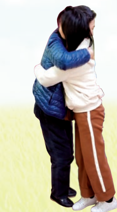
隊工日學習愛之語五種 語言一體驗身體接觸