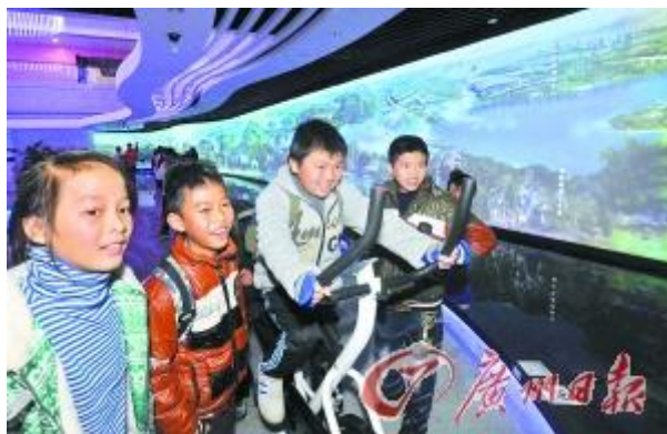
志願者與外來務工人員子女一起參觀新落成的廣州檔案館。

注: 圖表摘自團市委《在穗外來務工人員隨遷子女城市融入途徑》調查報告, 調查採取分層抽樣方法, 共選取 22 所公辦學校、10 所民辦學校隨遷子女共 561 人進行訪談。